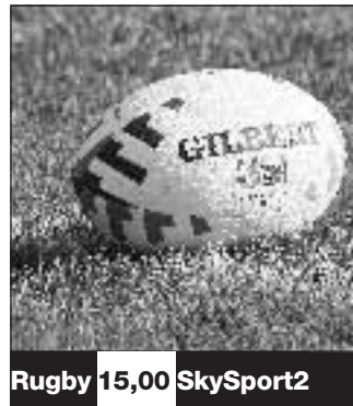
Rugby 15,00 SkySport2

«Non vorrei essere blasfemo, ma la storia di Benedetto XVI somiglia alla mia». Lo ha detto il ct Donadoni, parlando a «Petrus». «Benedetto XVI è arrivato dopo il pontificato indimenticabile di Giovanni Paolo II. Io sono arrivato alla nazionale dopo Marcello Lippi, che aveva vinto un mondiale»