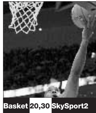
Basket 20,30 SkySport2