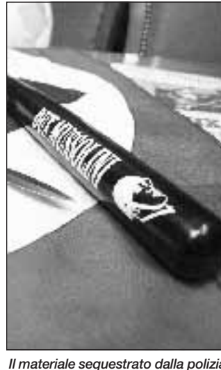
Il materiale sequestrato dalla polizia