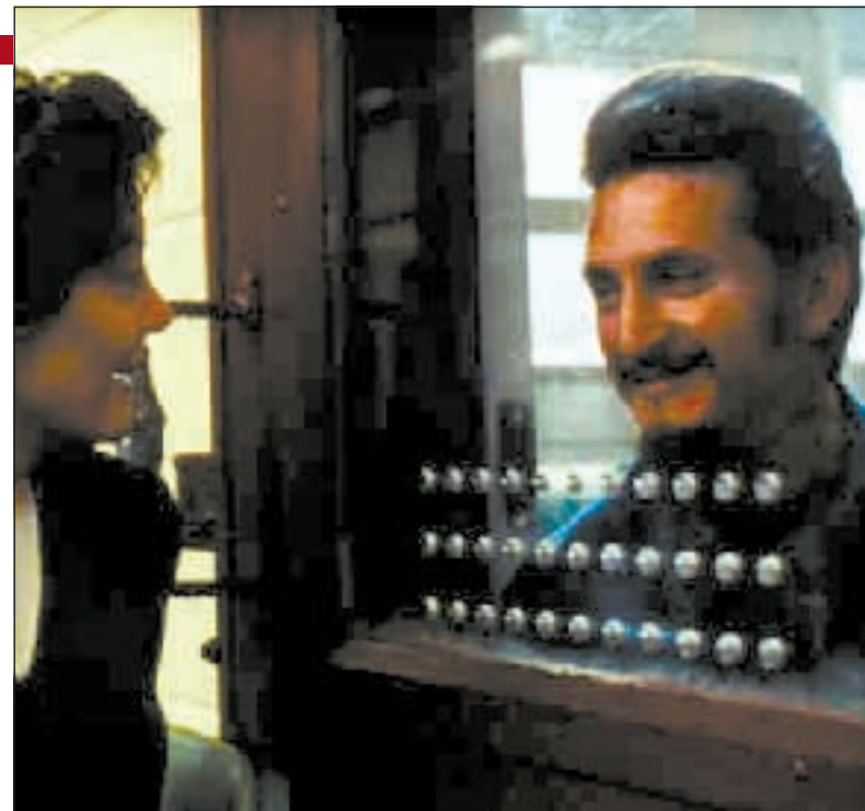
Susan Sarandon e Sean Penn in una scena di «Dead Man Walking»

traria, diretto nel '99 da un regista che decenni fa (sbagliando) avremmo considerato un forcaiolo, Clint Eastwood. Il cinema italiano ha raramente affrontato il tema, che d'altronde in Italia non è da tempo - fortunatamente - d'attualità. La spietata esecuzione dei due fantaccini Alberto Sordi e Vittorio Gassman nel finale della Grande guerra rimane indimenticabile, così come l'episodio dei Mostri in cui due spettatori assistono con cinica indifferenza, nel buio di un cinema, alla fucilazione di un gruppo di partigiani. Si tratta, come vedete, di esecuzioni in tempo di guerra. In realtà l'unico film italiano che parla lucidamente della pena di morte è Nell'anno del signore di Luigi Magni, sui due carbonari Angelo Targhini e Leonida Montanari giustiziati a Roma il 23 novembre 1825. La lapide che li ricorda, a piazza del Popolo, è ancora lì: utile per ricordare che l'Italia non è senza peccato, e che la ghigliottina era manovrata dal Papa.