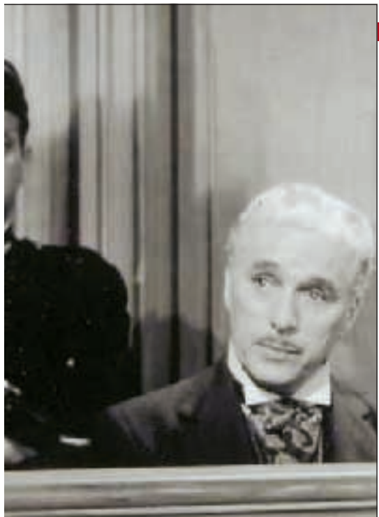
Charlie Chaplin in «Mr. Verdoux»

nalmente assentiva con un cenno del capo quando sentiva pronunciare il suo nome. Il giudice nella sentenza ha scritto: «L'imputato è appar-