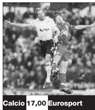
Calcio 17,00 Eurosport

Party vietati al Manchester United: stanco dei puntuali «eccessi» nei festeggiamenti della propria squadra, sir Alex Ferguson ha vietato ai giocatori ogni tipo di festa: tutta colpa della festa di Natale organizzata la scorsa settimana, diventata una sbronza collettiva e con presunta violenza sessuale