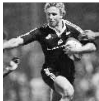
Rugby 15,00 Sky sport 2

Cominciato male, il 2007 di Adriano è finito anche peggio: il brasiliano, prestato per sei mesi al San Paolo, all'alba di San Silvestro è rimasto coinvolto in un incidente d'auto a Rio de Janeiro. Tre le vetture coinvolte oltre all'auto del centravanti, il colpevole del botto