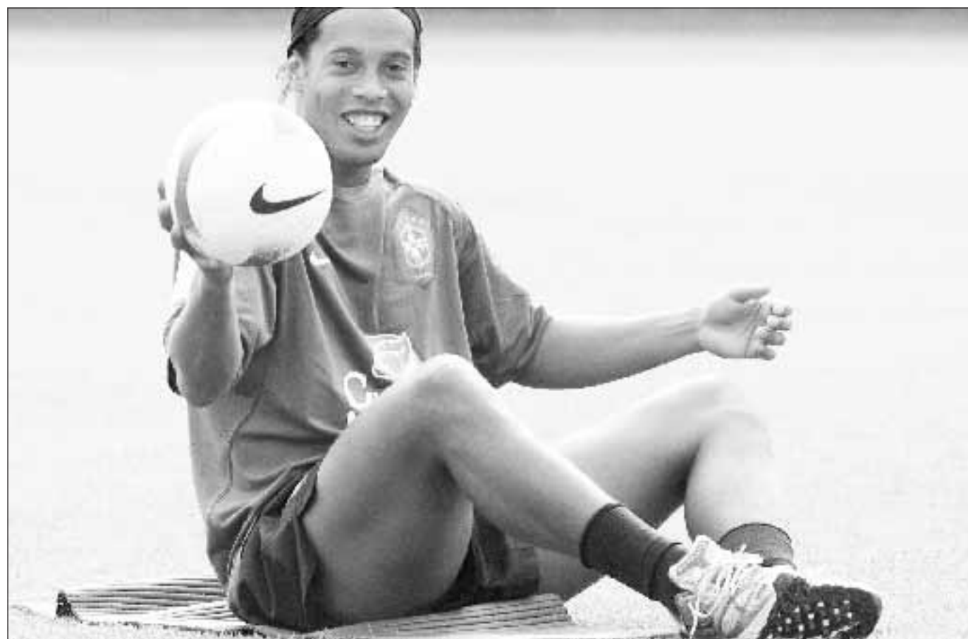
Ronaldinho, in allenamento con il Barcellona. Sotto, da sinistra a destra: Elano, Mutu, Van der Vaart, Emerson, Vieri

lio meno "pressante" della Premier League. L'Arsenal adesso sta muovendosi per Benzema, il miglior talento del calcio francese: vediamo come va a finire. Così l'Italia è costretta ad attendere il concludersi di crisi coniugali (quella fra Barça e Ronaldo) per farsi avanti, o a ripiegare sui 30enni (Ronaldo, lo scorso gennaio). Sogni di seconda mano. Ma sogni devono essere, e così si prepara un'altra abbuffata, di poca qualità, che si potrebbero coltivare nel proprio orto e comunque niente che possa colmare la differenza fra l'Inter e il resto delle contendenti. Anzi, quelli che possono operare con più liquidi e con meno affanno sul mercato sono proprio i nerazzurri, che sono a posto e cercano solo "chicche" per il centrocampo.