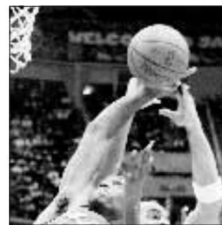
Basket 20,45 Malaga-Milano