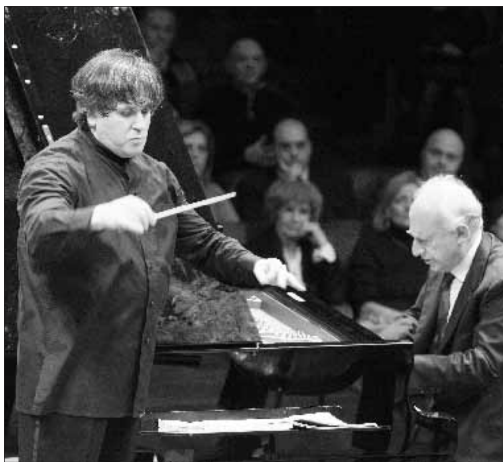
Il direttore Pappano e Pollini al pianoforte in concerto

traversare i picchetti», ha detto una fonte della Nbc. Un collaboratore dell'attore, candidato ai Golden per l'ottima interpretazione del bel film Michael Clayton, ha commentato che Clooney «non è proprio il tipo» da mettersi a fare il sindacalista. Gli sceneggiatori e autori scioperano perché vogliono che siano riconosciuti i diritti sulla circolazione ormai multimediale e diffusa nel tempo di film e programmi tv: circolazione che va dal videonoleggio a internet ai cellulari e che garantisce ulteriori introiti ai produttori. L'agitazione a oggi non mostra spiragli di soluzione e potrebbe colpire gli Oscar in due modi: lasciando la cerimonia senza battute (maestro delle cerimonie sarà il comico Jon Stewart), inducendo gli attori a boicottare l'evento per solidarietà con i colleghi scrittori. Uno scenario devastante per la Academy che trae ogni anno dagli Oscar la sua ragione di vita e di incassi.