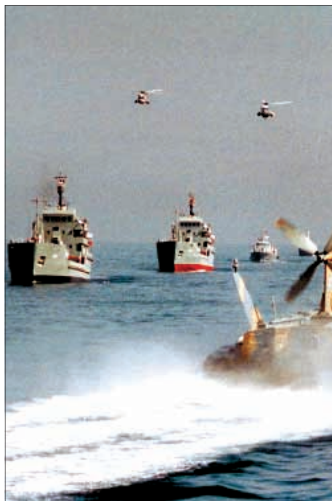
a pagina 12