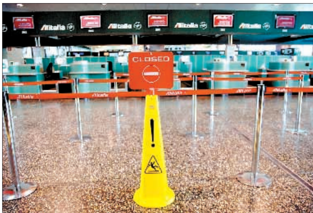
30 marzo 2008 primo giorno di Malpensa senza voli Alitalia, ridotti del 70%

to da Air France, da quelli del taglio della flotta agli esuberanti, quale carta Spinetta giocherà per tentare di imbastire un negoziato. Nel documento inviato l'altro giorno da Parigi il numero uno del gruppo aveva dichiarato che quei numeri (2.100 esuberanti) sono inevitabili. Di contro, i sindacati vogliono modificarli. Ad allentare, temporaneamente, la tensione di una vertenza che, come se non bastasse tutto il resto, ha avuto anche la sfortuna di incappare nella bagarre della campagna elettorale, è stata la boccata d'ossigeno dei 148 milioni che Alitalia rastrellerà grazie alla cessione delle sue azioni in Air France-Klm, per circa 79 milioni di euro, e al rimborso da parte dello Stato di un credito d'imposta Irpeg di 69 milioni. Contemporaneamente la partita dei cieli continua a tenere banco nel dibattito pre-elettorale. «Il Paese dovrebbe essere unito a sostenere la trattativa con Air France - ha detto ieri Walter Veltroni - la crisi di Alitalia non è iniziata oggi, per cui (rivolto a Berlusconi, ndr) lezioni non se ne possono fare su questo tema». Dal Pdl continuano ad arrivare richiami alla cordata italiana. «Air France colonizza Alitalia», denuncia Silvio Berlusconi.