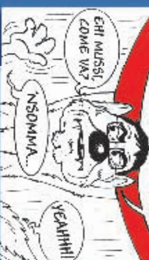
CHI MUSSI, COME VA?

NON MI HANNO ASCOLTATO, HANNO VOLUTO TOGLIERE LA FALCE E IL MARTELLO, E ABBIAMO BRUCIATO UN SACCO DI VOTI IDENTITARI! 2.600.000 VOTI SOLO PER IL SIMBOLD... LO SAPEVODI!