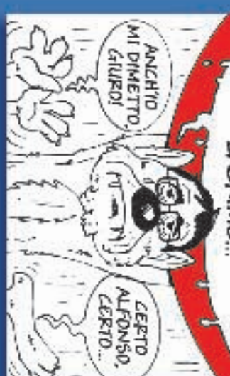
ANCHE MI DIMETTO GIURPO!