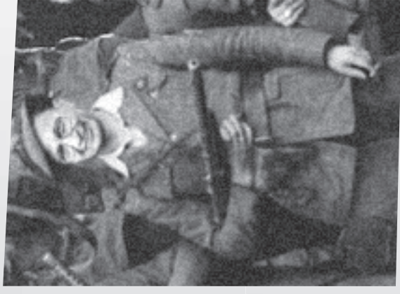
Il noto comandante partigiano Licio Gelli in posa