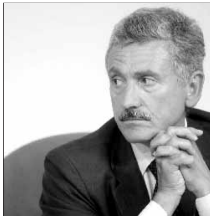
Il ministro degli Esteri Massimo D'Alema