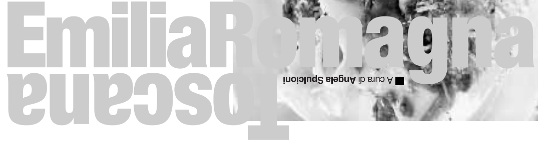
A cura di Angela Spulcrioni

Dal 4 al 13 Luglio presso il Parco Sacenti di San Matteo della Decima si terrà la Cucombrà, la 15a Sagra dei Sapori di Decima. L'evento, è dedicato ai cocomeri ed ai meloni, che sono prodotti degli agricoltori locali, ma sarà anche possibile assaggiare i piatti tipici locali, presso i ristoranti del luogo.