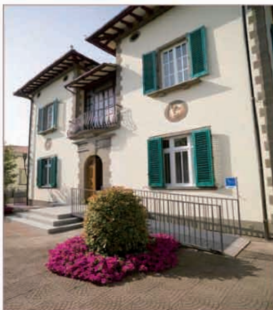
Eughenos è un Istituto privato, non convenzionato con il Sistema Sanitario Nazionale, che eroga prestazioni a pagamento.