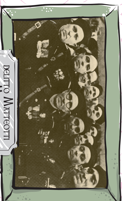
DELITTO MATTEOTTI LODO MUSSOLINI 1924

Nel 1956 i ministri della Difesa e degli Esteri decisero di impedire il processo per i nazisti che sterminarono 6500 militari della divisione Acqui. I soldati italiani si erano già arresi. La giustizia italiana si arrenderà per non compromettere gli equilibri della Nato.