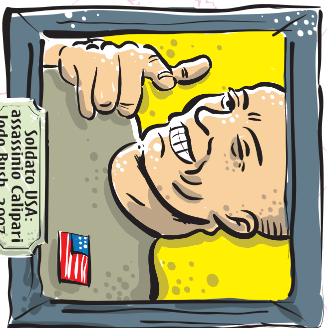
Soldato USA: assassino Calipari Lodo Bush, 2007

Nel 1983 la giunta militare argentina proclamò l'autocandidatura per tutti i militari accusati di aver violato i diritti umani