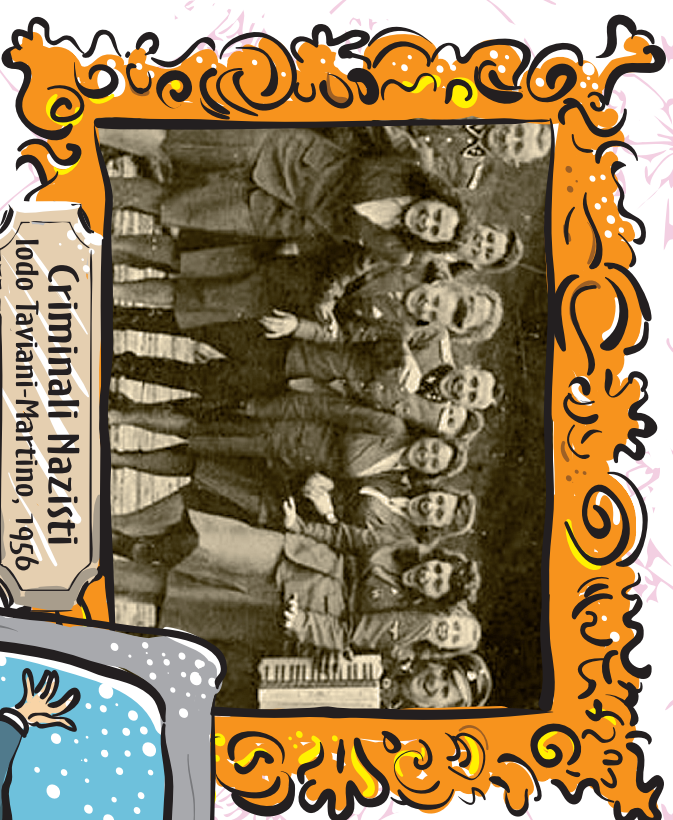
Criminali Nazisti Lodo Taviani-Martino, 1956

Il 3 febbraio 1998 un aereo militare USA tranciò un cavo della funivia del Cernis: 20 morti, aereo ed equipaggio salvi, la giustizia americana vola basso e assolve, quella italiana sta a guardare.