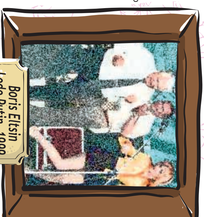
Boris Eltsin Lodo Putin, 1999

Nel 1998, Pinochet, dopo aver abbandonato il comando dell'esercito, diventa senatore a vita con tanto di immunità parlamentare: a vita, pure quella.