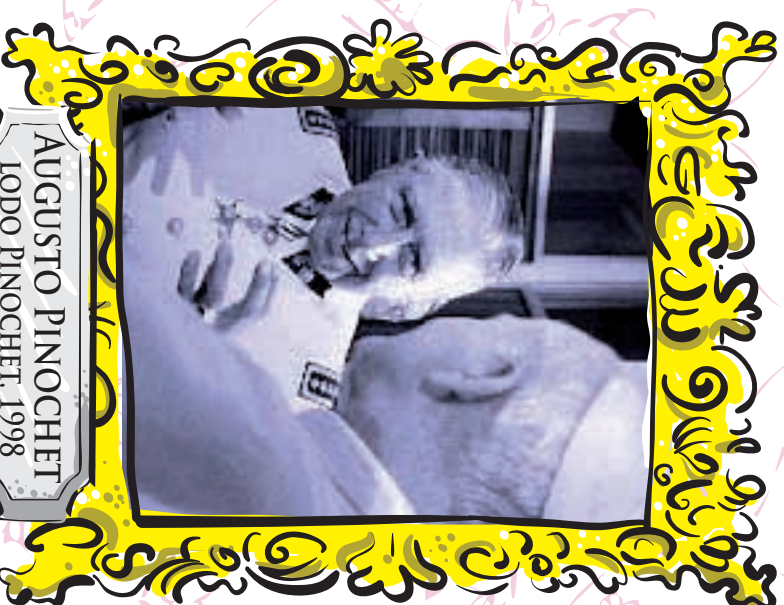
AUGUSTO PINOCCHET LODO PINOCCHET, 1998

Le autorità americane si oppongono al processo in Italia e alla rogatoria internazionale nei confronti del soldato Lozano, responsabile dell'assassinio di Nicola Calipari, avvenuto in Iraq il 4 marzo 2005 durante la liberazione della giornalista Giuliana Sgrena.