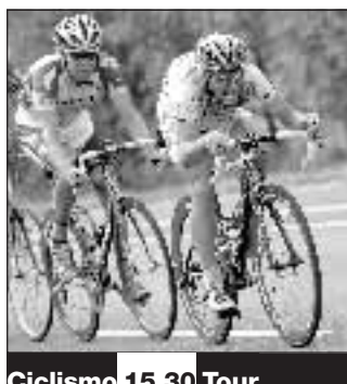
Ciclismo 15.30 Tour

L'attaccante azzurro e della Sampdoria Antonio Cassano giura eterno amore a Carolina, pallanuotista ligure di 17 anni: «Amo quest'angelo di ragazza, che mi ha cambiato la vita. Per lei ho messo da parte le cassanate, perché non voglio deluderla. Per fortuna sono rimasto a Genova»