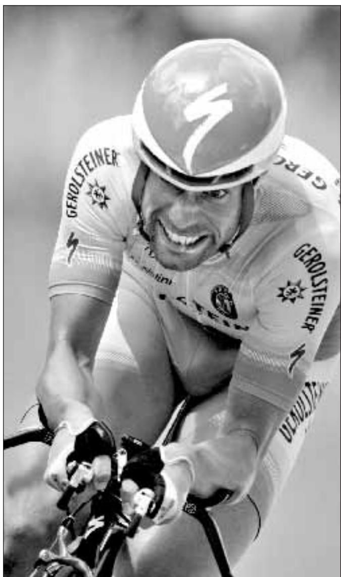
Il tedesco Stefan Schumacher vincitore della crono