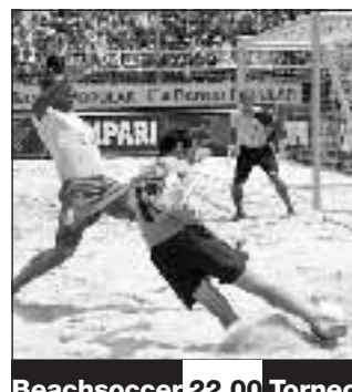
Beachsoccer 22.00 Torneo