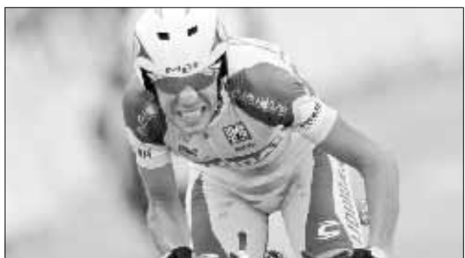
Nibali, decimo tempo all'arrivo

Ferrari, Raikkonen ● «Dobbiamo reagire senza isterismi» Dopo la disfatta di Silverstone il finlandese della Ferrari ha le idee chiare: «Ora dobbiamo guardare avanti alla prossima gara e reagire senza isterismi. Sappiamo di avere una macchina vincente dobbiamo soltanto avere un fine settimana senza grandi problemi».