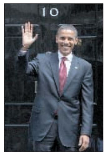
De Giovannangeli Rezzo pag. 9