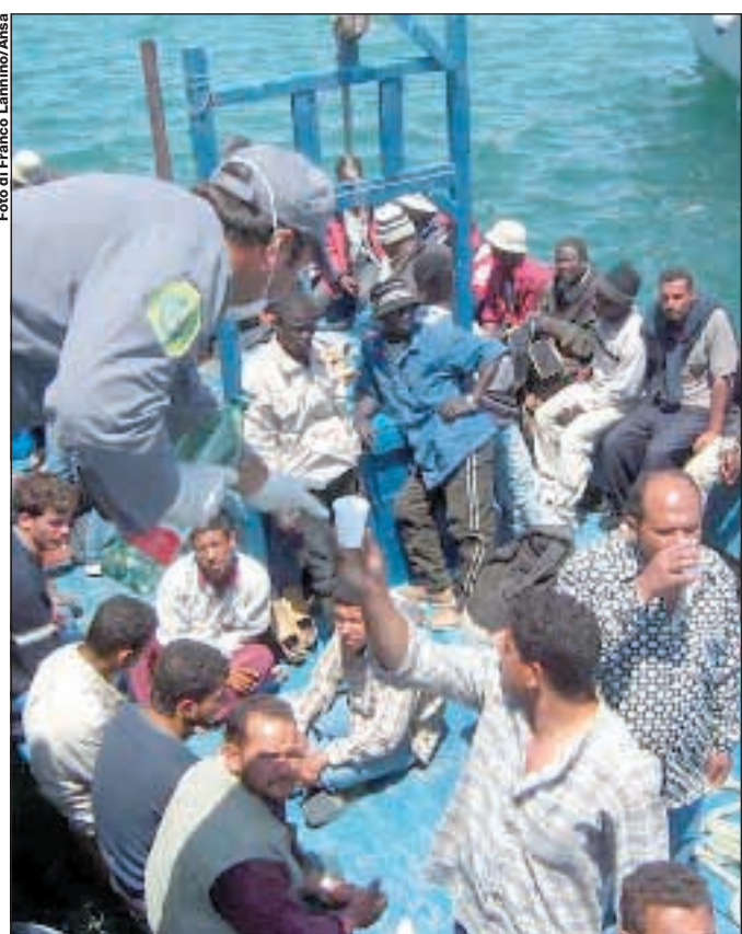
Tarquini, Amurri, Fallica, Sebastiani alle pagine 2 e 3