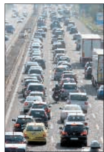
Vannucci a pagina 8