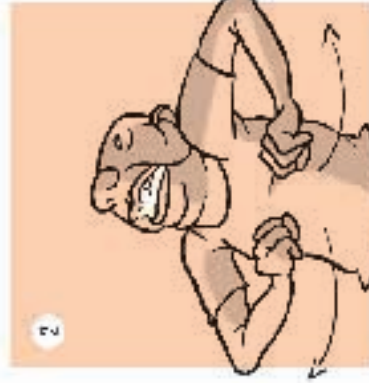
REMMIE UMIRI I PUGNIE TIRI E I TO ETO