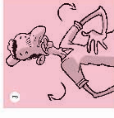
DIGIUNARE STOR E I A T' SERVO MAFIC la mano a le, pezzi, della pancia