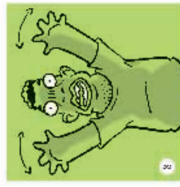
EMERGENZA. E' il nome le mani e d'ora in poi, maffiasc, per la fare, si spallano la