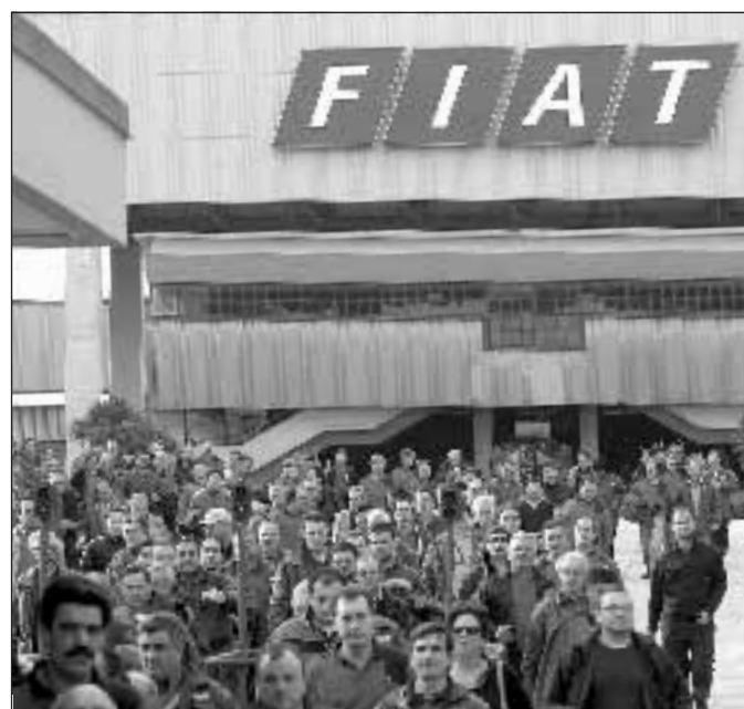
L'uscita degli operai Fiat di Cassino (Frosinone)

nuovo in pausa dal 24 al 28 novembre. Unici a non fermarsi, gli operai di Cassino, impegnati nella produzione della Mito, a cui vanno aggiunti circa mille dipendenti di Mirafiori, anch'essi al lavoro sul nuovo modello Alfa Romeo. Non solo auto. Tra gli altri stabilimenti del gruppo torinese interessati dalla Cig, quello della Powertrain di Verone, Biella, che diminuirà i turni dal 15 settembre al 27 dello stesso mese. Dal 22 settembre, la Fma di Avellino, già interessata dalla cassa integrazione l'ultima settimana di agosto, sarà di nuovo in Cig. Per i 2.400 operai di Avellino, poi, sono previsti tre giorni di stop ad ottobre e altri due nel mese di novembre.