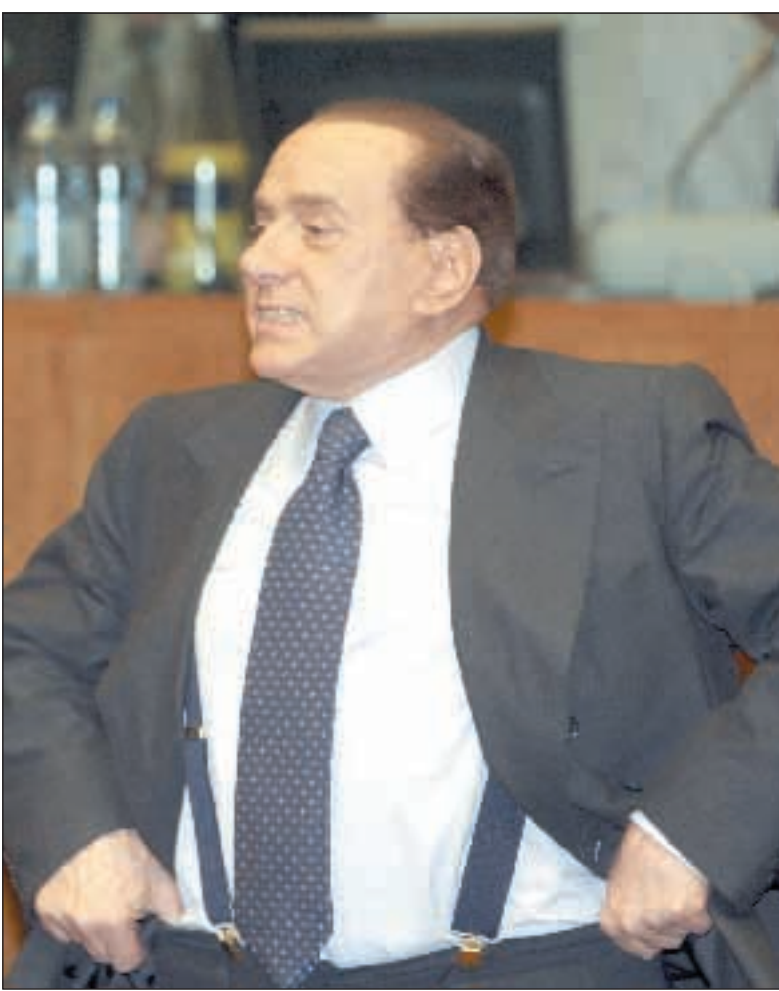
Silvio Berlusconi ieri al vertice di Bruxelles.

Nei momenti di crisi i fondi etici fruttano rendimenti migliori. È quanto risulta dai dati di Etica Sgr, la società di gestione del risparmio di Banca Popolare Etica, che può contare su circa 10 mila clienti e su una raccolta pari a 240 milioni di euro. Spicca il fondo monetario che al 30 settembre rispetto allo stesso periodo 2007, ha reso il 3,66% netto rispetto al 3,56% del valore di riferimento di mercato. L'obbligazionario misto invece ha reso lo 0,88% (contro -0,0003%). Risultato in rosso, ma anche in questo caso meglio del benchmark, per il bilanciato che ha perso il 10,27% (-13,79%) e l'azionario che ha ceduto il 18% (-1,17%). «I fondi etici reagiscono meglio degli altri nei momenti di difficoltà perché non prevedono alcun tipo di investimento speculativo che può dare grandi profitti ma anche grandi perdite».