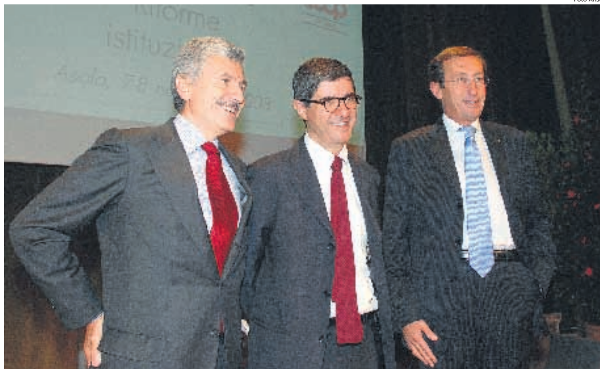
Massimo D'Alema, Gianni Riotta ed il presidente della Camera dei Deputati, Gianfranco Fini, ieri ad Asolo

Sotto la rocca asolana va in scena il primo test della sinergia tra le fondazioni dei due leader, la dalemiana Italiani Europei e la finiana Fare Futuro. Seguirà, dal 2009, una summer school itinerante. Per intanto il convegno sulle riforme istituzionali è stata occasione di rinverdire il feeling politico tra i due e registrare l'apertura di Fini al sistema tedesco. Sintonia esibita anche durante la cena bipartisan con i gio-