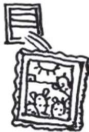
IL QUADRO DI GUTTUSO