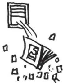
LE FIGURINE DEI CALCIATORI