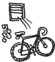
LA BICICLETTA DI PRODI

ULTIMO DELL'ANNO 2008; VELTRONI BUTTA DALLA FINESTRA LE COSE VECCHIE DEL PD