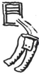
I MUTANDONI DI GRAMSCI