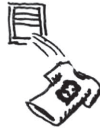
LA MAGUETTA DEL CHE