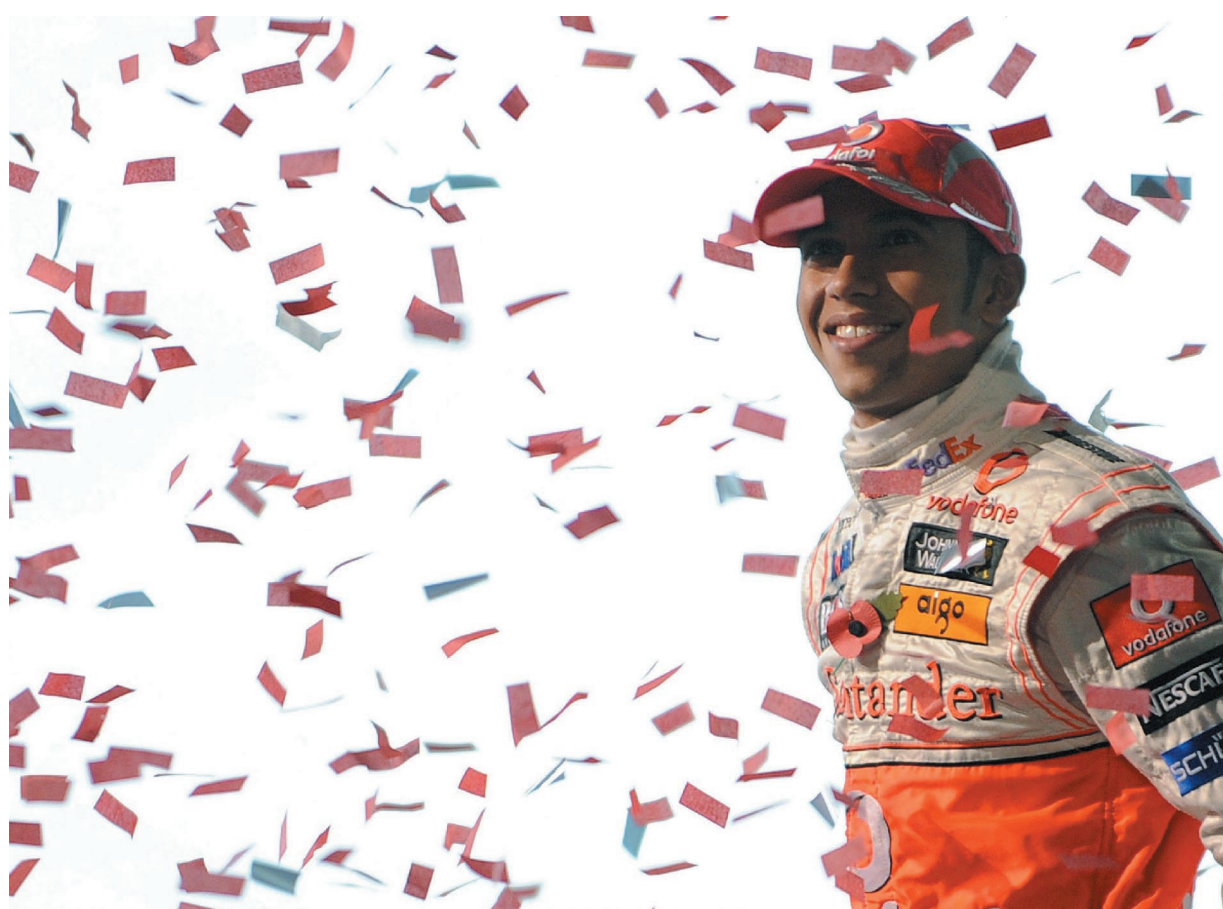
Lewis Hamilton: l'anglo-caraibico è stato il primo pilota di colore a vincere un campionato del mondo di Formula 1

Alti e bassi, imprese e nefandezze, medaglie d'oro e medaglie di cartone (per non dire di peggio). Il meglio e il peggio dello sport 2008, in ordine sparso, tentando un'oggettività festaiola oggettivamente impossibile. Questa scorribanda nell'anno che sta per finire contiene idealmente uno spazio bianco: riempitelo voi, pensando ai «vostri» momenti sportivi, quello che vi ha fatto sognare e quello che vi ha fatto incazzare. Il meglio e il peggio del 2008 arriverà nel 2009. Il meglio saranno gli ottavi di Champions con il duello Italia-Inghilterra: sei grandi partite, almeno sulla carta, che ci diranno chi siamo. In realtà il verdetto non è sulla salute del calcio italiano, ma