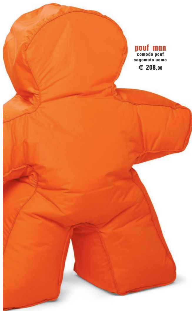
pouf man comodo pouf sagomato uomo € 208,00