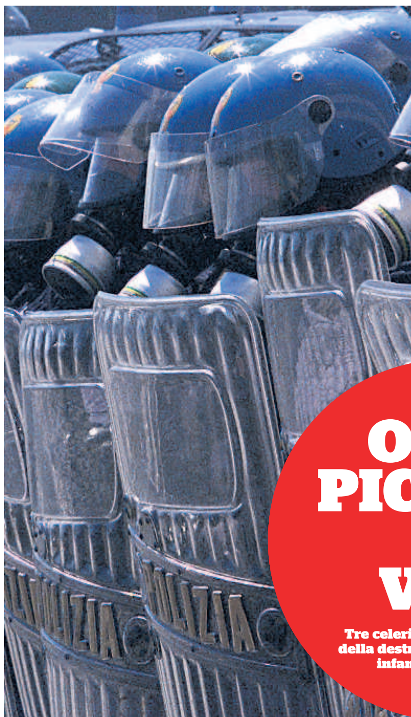
Antisommossa Poliziotti schierati a Genova durante il G8 del 2001

Ma soprattutto storie di odio, un odio che scorre nelle vene della società, che cova per anni, mesi e giorni fino a schizzare fuori travolgendo tutto. Nei marciapiedi intor-