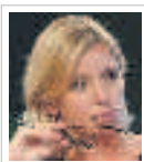
CONCITA DE GREGORIO Direttore cdegregorio@unita.it http://concita.blog.unita.it