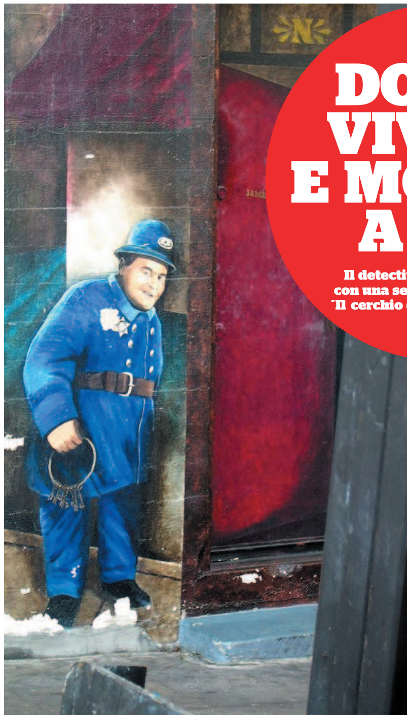
Un murale tra le vie di Los Angeles

C'è stato un tempo, una settantina d'anni fa, in cui nel nascente genere noir (romanzi e film), non c'era private-eye che non dovesse fare i conti con la sua doppiezza, la sua cupidigia, il suo appetito sessuale. Ora in perfetta sintonia, anzi a dir la verità anticipandone l'allarme sociale, il noir è il punto di massimo riscontro di una guerra, neanche tanto strisciante, che vede l'uomo contro la donna: una nemica da sevizare, stuprare, picchiare, uccidere. E non mi riferisco solo agli Uomini che odiano le donne di Stieg Larsson, perché Michael Connelly, il più celebrato degli scrittori statunitensi di genere poliziesco, il creatore del detective di Los Angeles Hieronymus (Harry) Bosch e del criminologo dell'Fbi Terry McCaleb è stato uno dei primi a sorvegliare il crimine che colpisce le donne, a cominciare dalla madre dello stesso Bosch, uccisa quando lui era un ragazzo. Basta scorrere, per chi non è un lettore seriale di Connelly, solo le sinossi di copertina per vedere materializzarsi