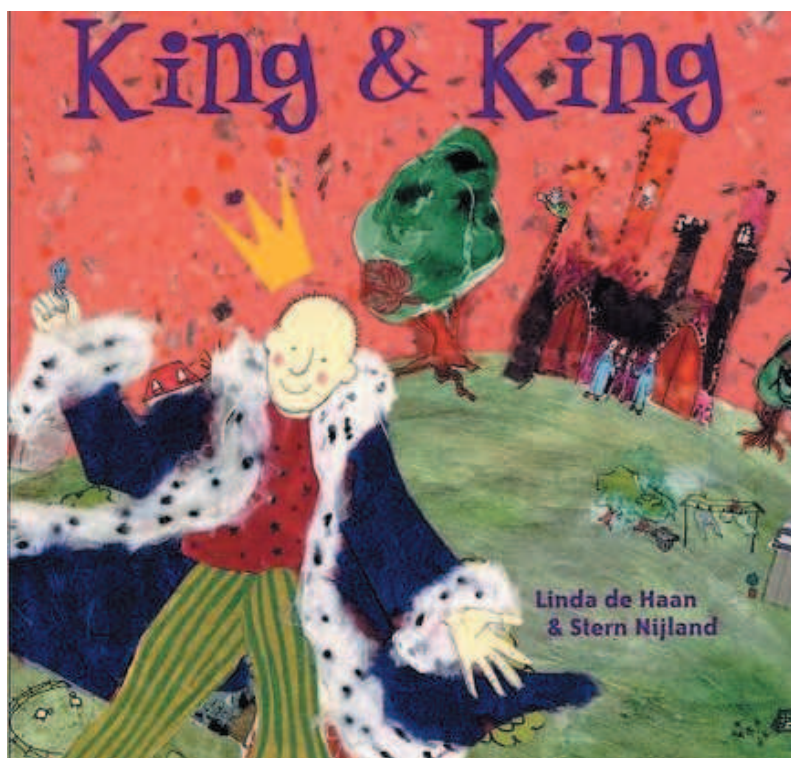
I principi azzurri La copertina del libro per bambini «King & King»