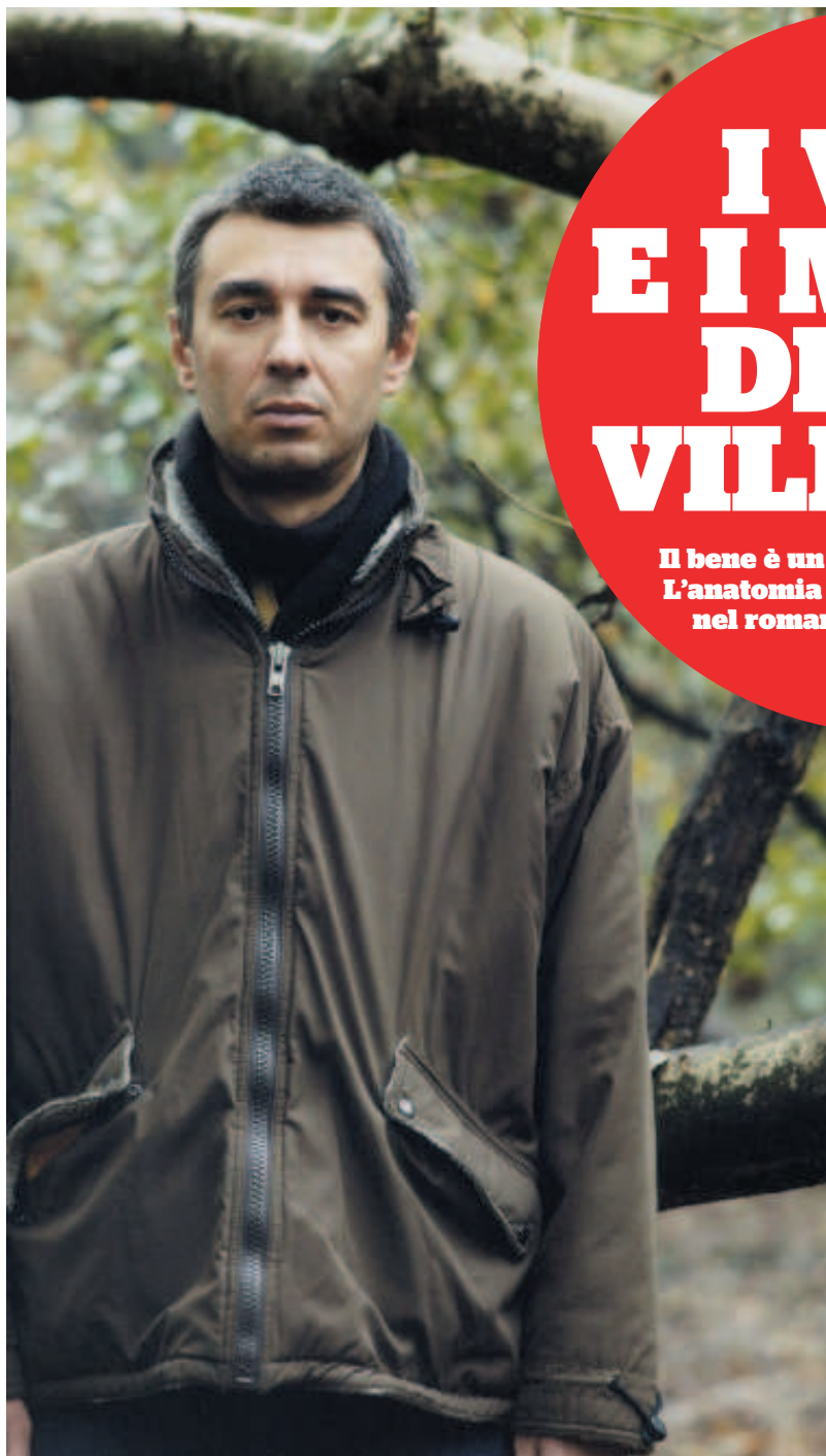
Lo scrittore Giorgio Falco