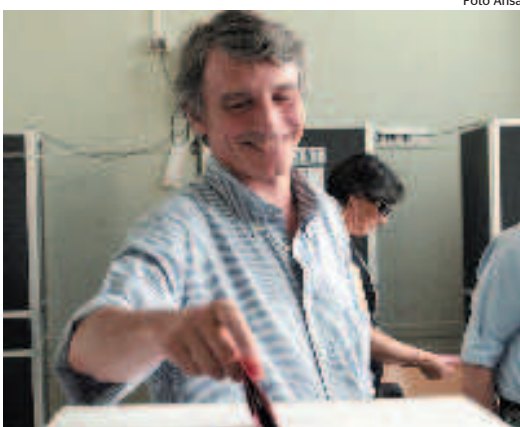
David Sassoli ha votato alla scuola media Dante Alighieri