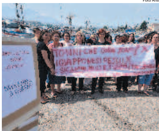
La protesta delle mogli dei pescatori di Porticello