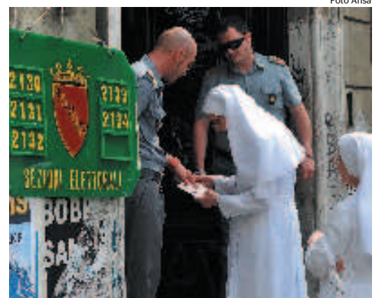
Due suore chiedono informazioni in un seggio