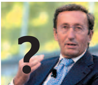
GIANFRANCO FINI PRESIDENTE DELLA CAMERA