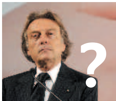
LUCA CORDERO DI MONTEZEMOLO PRESIDENTE DELLA FIAT

Le uscite troppo istituzionali di Fini, restano una spina nel fianco. Non solo per Berlusconi