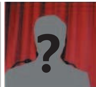
IL PERSONAGGIO OMBRA TECNICO O POLITICO?

del Tesoro proiettato verso mete più ambiziose. I boatos lo danno come pronto a sostituire Draghi