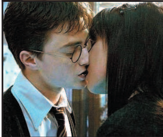
In basso: il bacio di Giuda di Giotto conservato nella cappella degli Scrovegni. Qui sopra il primo bacio di Harry Potter. Più in alto quello premiato dal «Sun» in Spiderman. In alto a destra il bacio «lesbo» tra Madonna e Britney Spears.