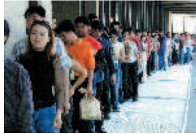
La passata sanatoria

Salasso anche per avere la cittadinanza. Per ottenere la documentazione si dovranno pagare 200 euro. Per il permesso di soggiorno invece la tassa sarà fissata dai ministeri dell'Interno e dell'Economia tra gli 80 e i 200 euro.