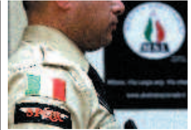
Le ronde nere

Associazioni di cittadini potranno pattugliare il territorio e segnalare alle forze dell'ordine situazioni di disagio sociale o di pericolo. Saranno iscritte in elenchi e dovranno essere formate prioritariamente da ex agenti.