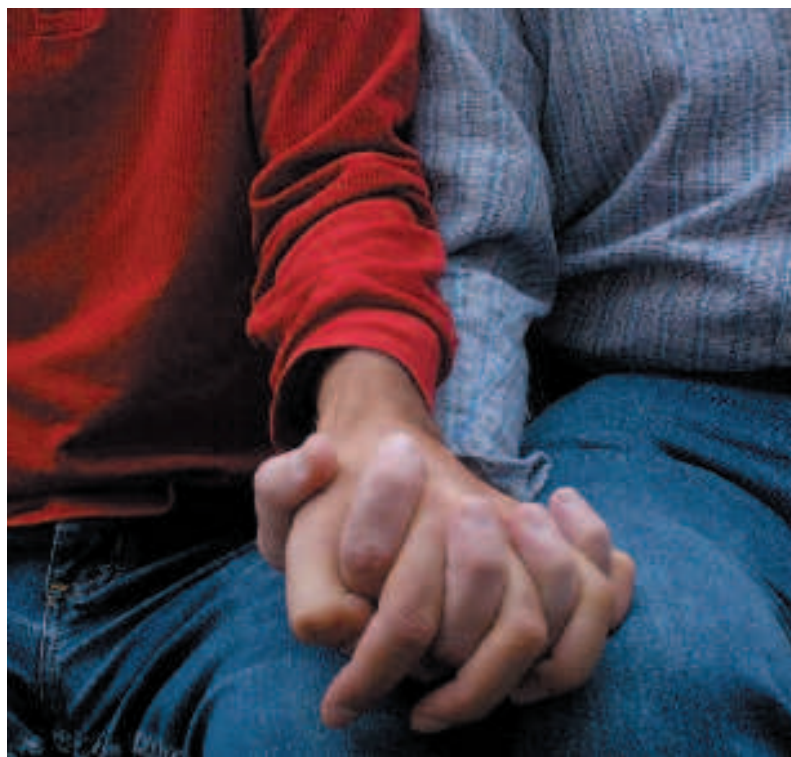
Per mano Gesto d'affetto di una coppia