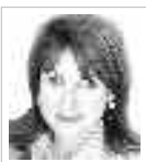
LORETTA NAPOLEONI Economista