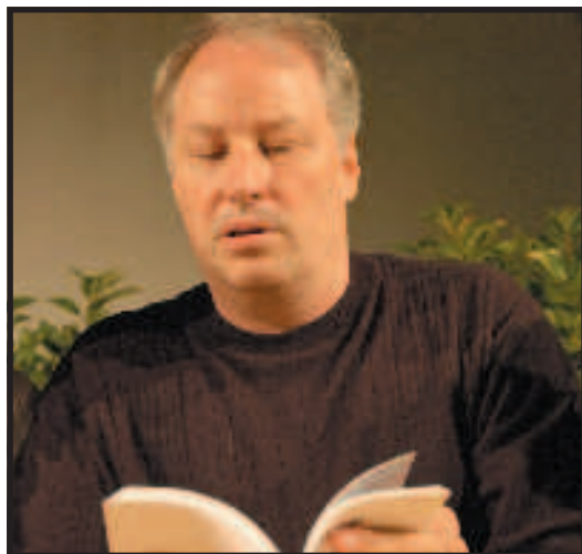
Joe R. Lansdale