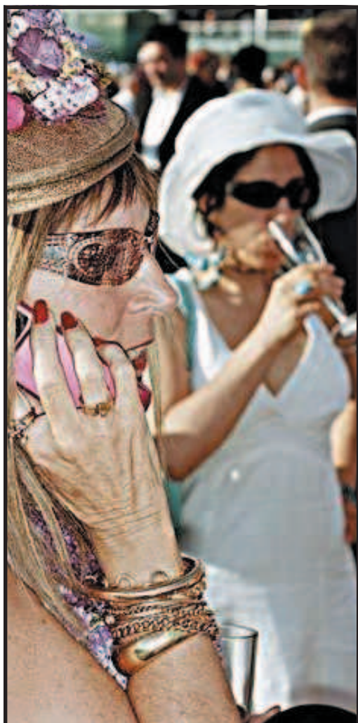
Un'immagine di Martin Parr della serie «Luxury»