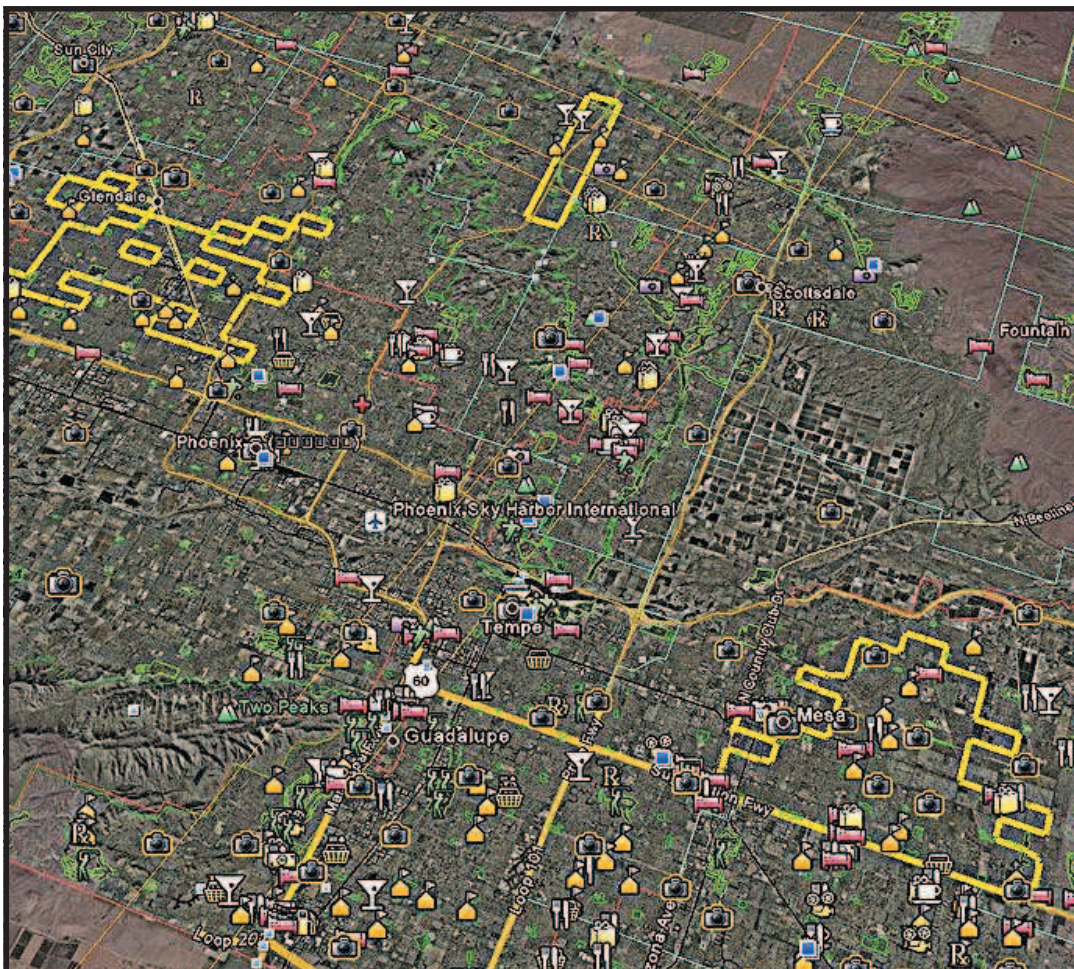
Space Invaders a Phoenix, Arizona. Sopra «Fuck», con tanto di dito alzato, sulle strade di Dublino