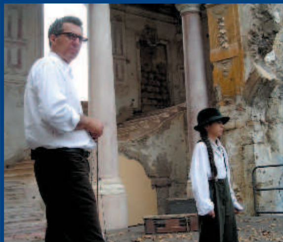
«Prove per una tragedia siciliana»