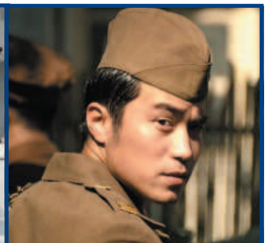
«Yonfan - Prince of Tears»