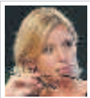
CONCITA DE GREGORIO Direttore cdegregorio@unita.it http://concita.blog.unita.it