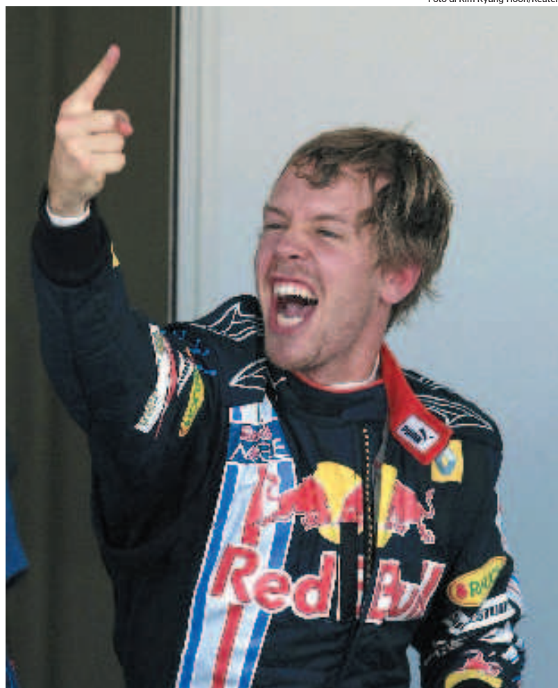
Sebastian Vettel a Suzuka: è il più giovane pilota ad aver vinto un Gp e fatto una pole

non è andato a punti. Tanto che la BrawnGp è a un passo dal titolo costruttori, che conquisterà di sicuro tra quindici giorni in Brasile. Lasciando magari il verdetto per il titolo più importante, quello di campione del mondo, al Gp di Abu Dhabi. Arriviamo adesso alla Ferrari. Raikkonen è arrivato quarto, ottenendo il massimo che può dare una monoposto, come la F60, nata male. Di Fisichella forse è meglio non parlarne. Per la terza volta consecutiva su tre gare disputate, non ha raccolto nemmeno lo straccio di un punto, visto il 12° posto. E con questa sono la bellezza di 5 Gp che la seconda Ferrari a titolo di cronaca. «Il mio feeling con la F60? È migliorato, sta andando sempre meglio» ha incredibilmente dichiarato Fisichella. In quanto ad Alonso promette pace e amore nei confronti di Massa, visto che i due ebbero una querelle non da poco nel 2007, quando Fernando era in McLaren. Stamattina intanto Massa sarà a Maranello. La Fia ha infatti autorizzato la Ferrari a far provare una F1 al brasiliano «purchè non sia quella di quest'anno e monti gomme della GP2». Massa si allenerà con un simulatore disponibile a Modena, poi la prova con "F1 Clienti", come fece Schumacher la scorsa estate. Per tornare in Brasile o ad Abu Dhabi»