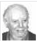
DARIO FO PREMIO NOBEL PER LA LETTERATURA