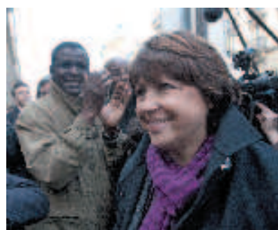
La leader socialista Martine Aubry

Successo storico Sinistra unita al 54%, vince in tutto il Paese. A Sarkozy solo l'Alsazia e il 34% → ALLE PAGINE 16-17