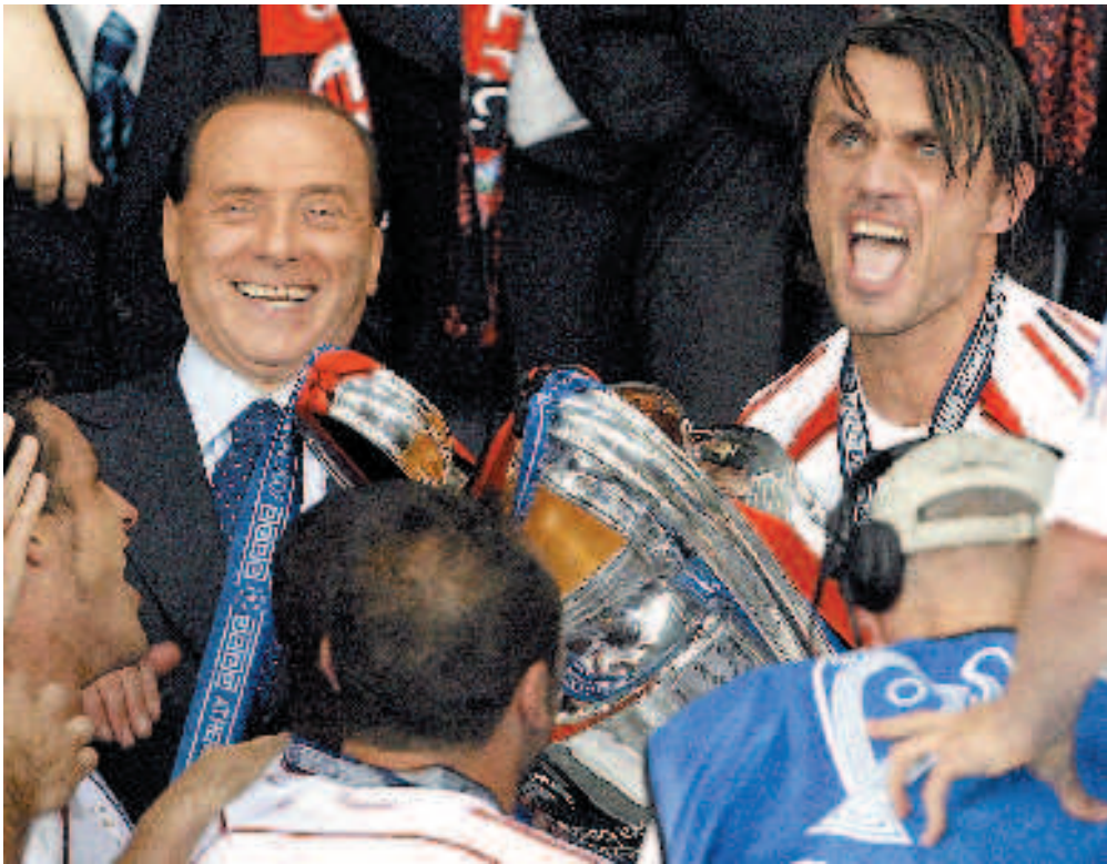
Atene, 23 maggio 2007: il Milan batte il Liverpool ed è campione d'Europa. Berlusconi festeggia con la squadra

anni che compri bidoni e figurine – recita uno striscione esposto in curva Sud il 23 maggio – quest'anno chi compri... le veline?». E ancora: «Vendi Kaká per risanare la società, e non spendi più i tuoi milioni. Caro Berlusconi grazie di tutto e vai fuori dai coglioni». Ci si mette anche l'attaccante brasiliano che qualche giorno dopo, dal ritiro del Brasile per la Confederations Cup, firma autografi sulla maglia del Real. Le smentite del club rossonero sono ogni giorno meno convinte e il futuro sembra già scritto: Kaká si concederà alle smanie di Florentino Perez e Carlo Ancelotti convolerà a nozze con Roman Abramovich sulla panchina del Chelsea. Due bandiere ammainate in pochi giorni sono troppe, e la rabbia della curva sale a livelli di guardia. A far infuriare tutti è soprattutto l'atteggiamento del Milan, il silenzio imbarazzato di chi è costretto a tacere per ordine superiore. Perché la realtà è che mancano ormai quindici giorni soltanto alle elezioni europee, e annunciare adesso la cessione di Kaká potrebbe rivelarsi un autogol da pagare caro nel segreto dell'urna. I tifosi lo sanno bene e giocano l'ultima carta, quella più rumorosa. Il 6 e 7 giugno sarà eletto anche il nuovo presidente della Provincia di Milano e il passaparola fra i gruppi organizzati è categorico: «Voto Podestà (il candidato del centrodestra, ndr) solo se resta Kaká».