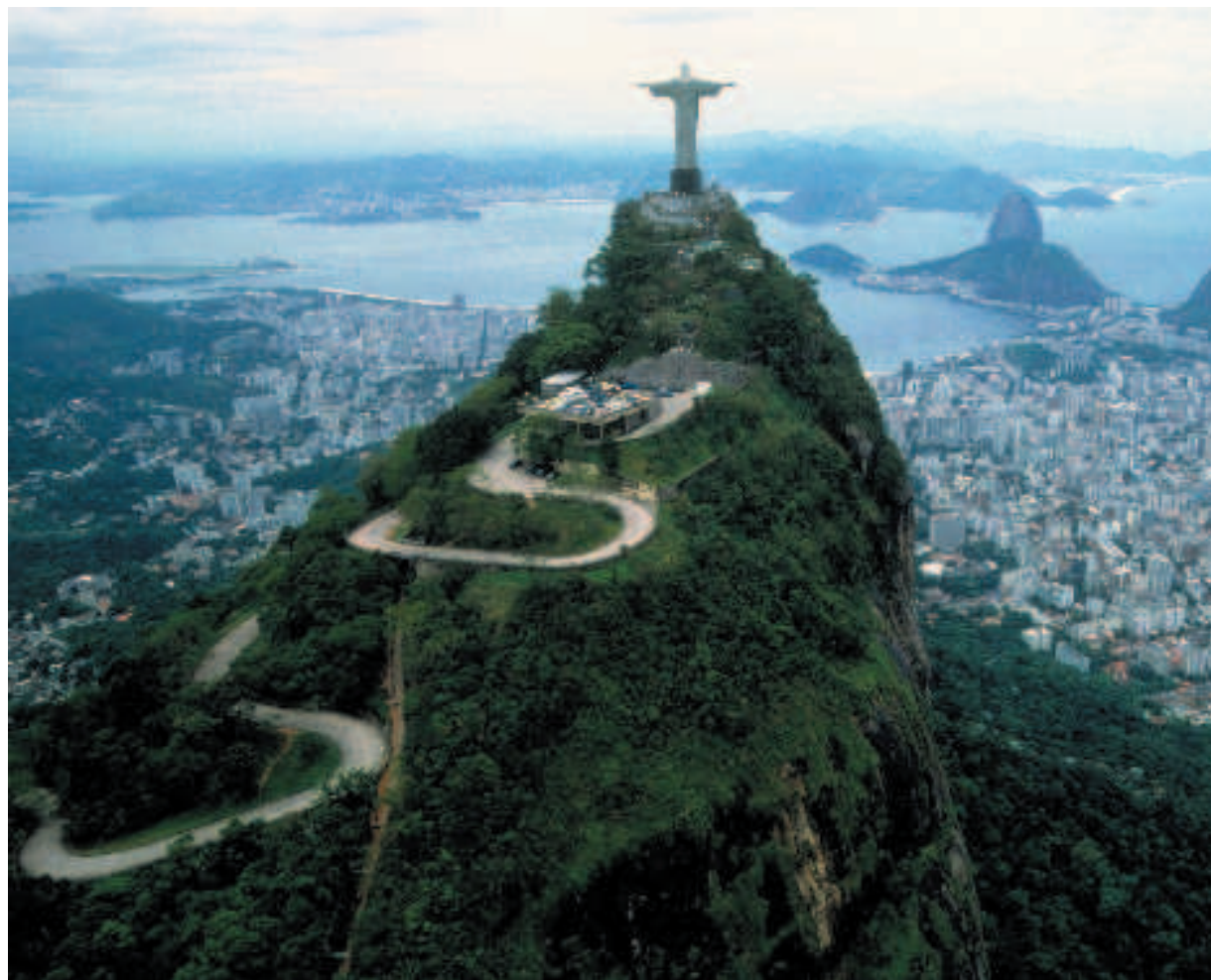
Il Corcovado La montagna al centro di Rio de Janeiro, Brasile

Eulálio d'Assumpção, io narrante di «Latte versato», rivive i cento anni della sua vita mentre giace moribondo. Nei dettagli di una biografia ossessionata dalla figura della moglie Matilde (mulatta sensuale e libertina) e dallo sgretolamento della sua passata grandeur si snoda, in un inarrestabile monologo venato di lirismo amaro, rabbia e rimpianto, ma anche di una irresistibile ironia, l'affresco di una saga familiare le cui origini risalgono allo splendore della corte di Rio de Janeiro e arrivano a oggi, seguendo una curva discendente di ineluttabile declino.