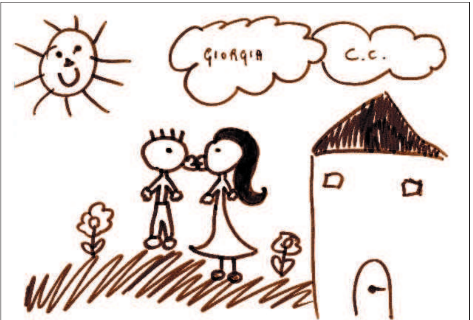
LA SPERANZA Un uomo e una donna che si baciano. Dietro di loro una casa (nuova, senza crepe). Le certezze nel disegno di un bambino dell'Aquila