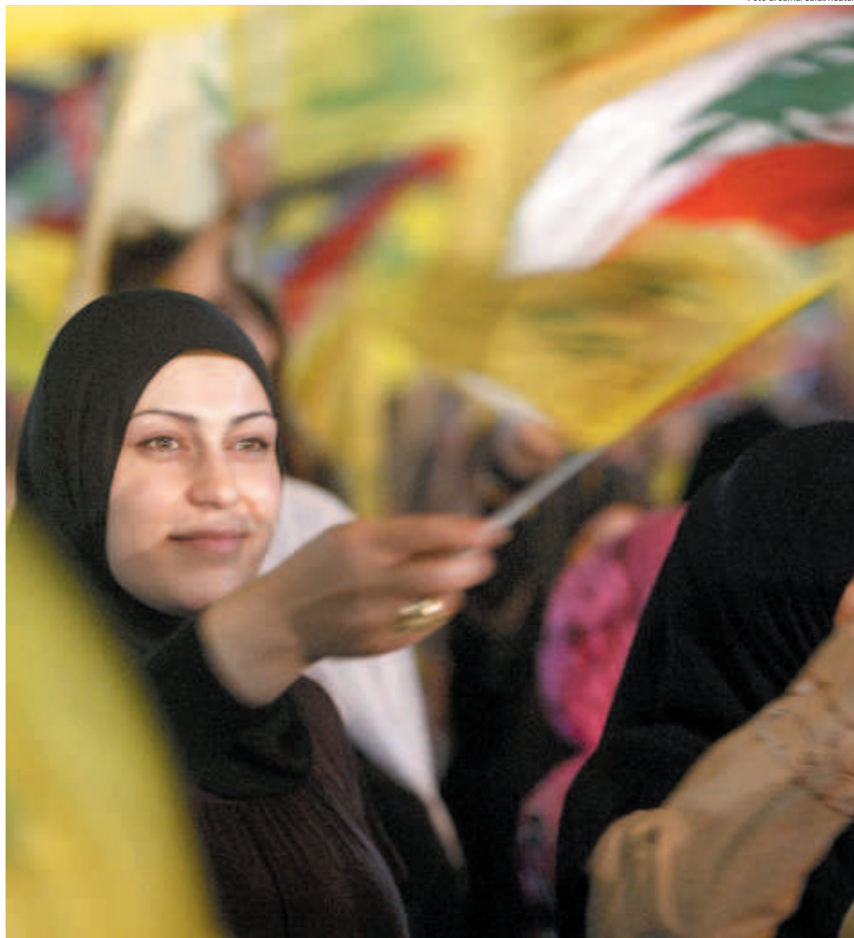
Beirut Una donna libanese sventola una bandiera nel giorno della Liberazione (25 maggio 2009)