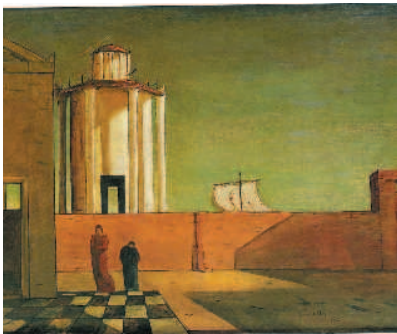
Giorgio De Chirico «L'énigme de l'arrivée et de l'après-midi», 1911-12

Ampia retrospettiva con un centinaio di dipinti di grande formato, oltre a numerosi disegni, collages e sculture, dedicata all'artista pop americano del quale, per la prima volta, vengono indagati i lavori realizzati appropriandosi delle immagini tratte dalla storia dell'arte.