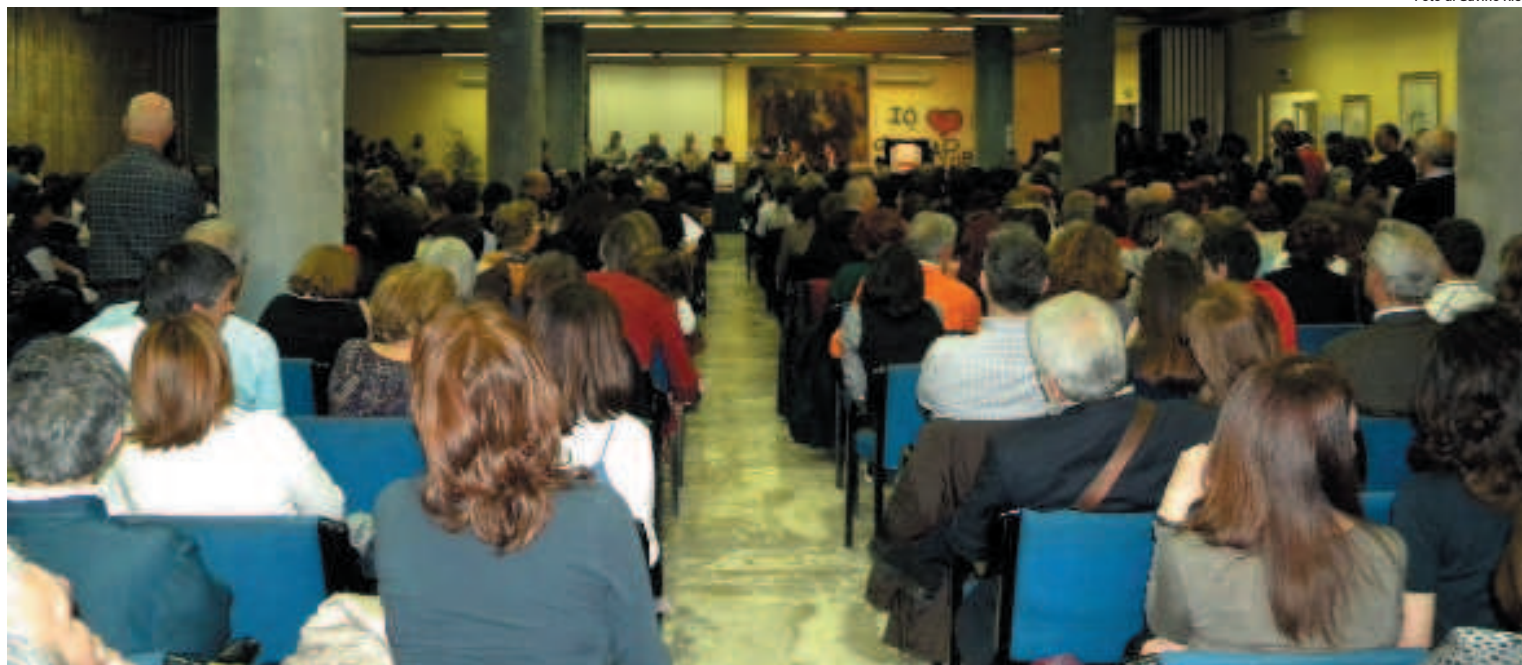
Un momento dell'incontro della redazione dell'Unità mobile con gli insegnanti a Sassari