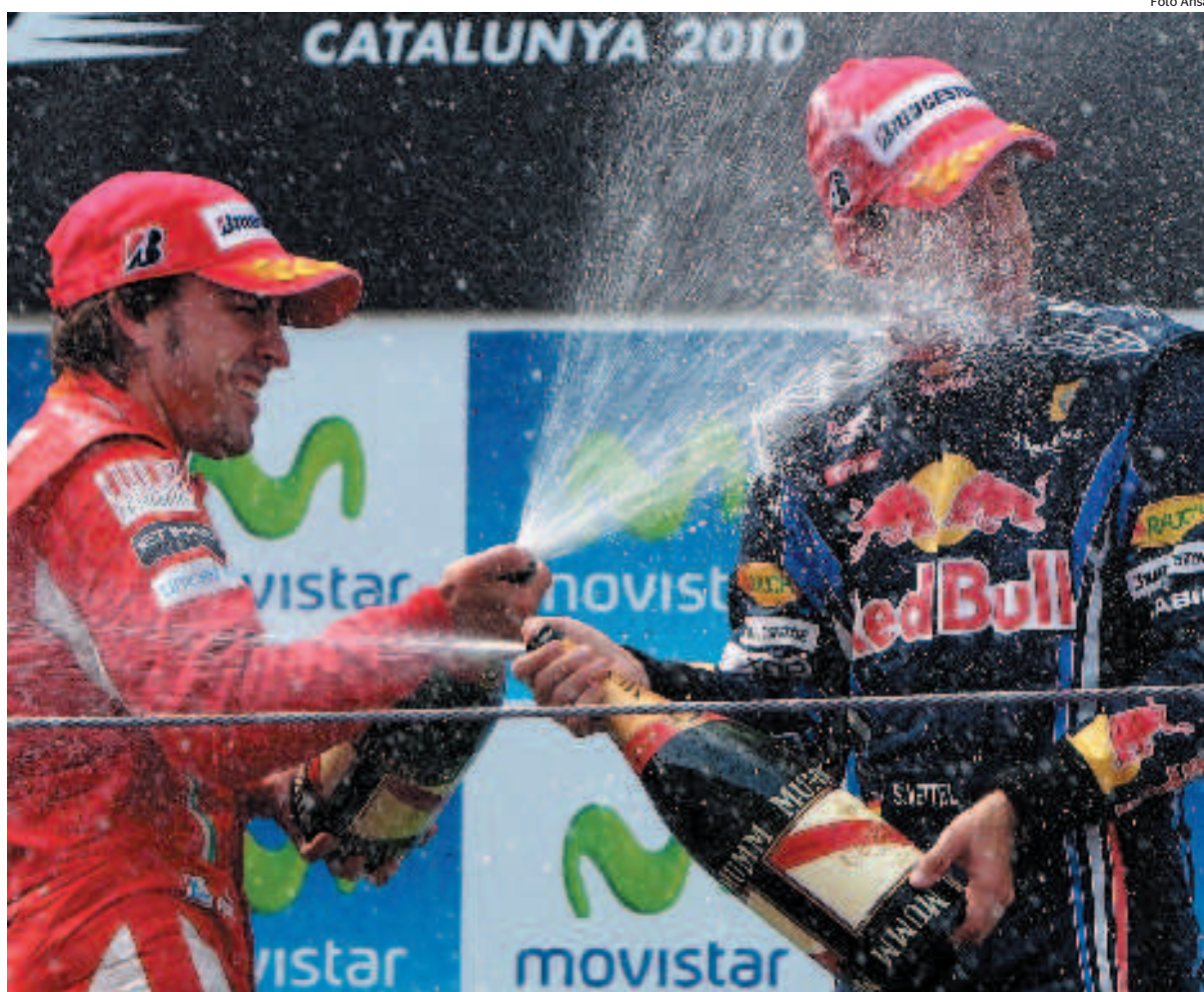
Fernando Alonso e Sebastian Vettel festeggiano sul podio

Noiosa la gara a Montmelò, le Red Bull ancora padrone della scena e sfiora la doppietta. La Ferrari seconda ma senza entusiasmare. Rimonta Schumacher che prende punti e morale. Equilibrio in classifica mondiale.