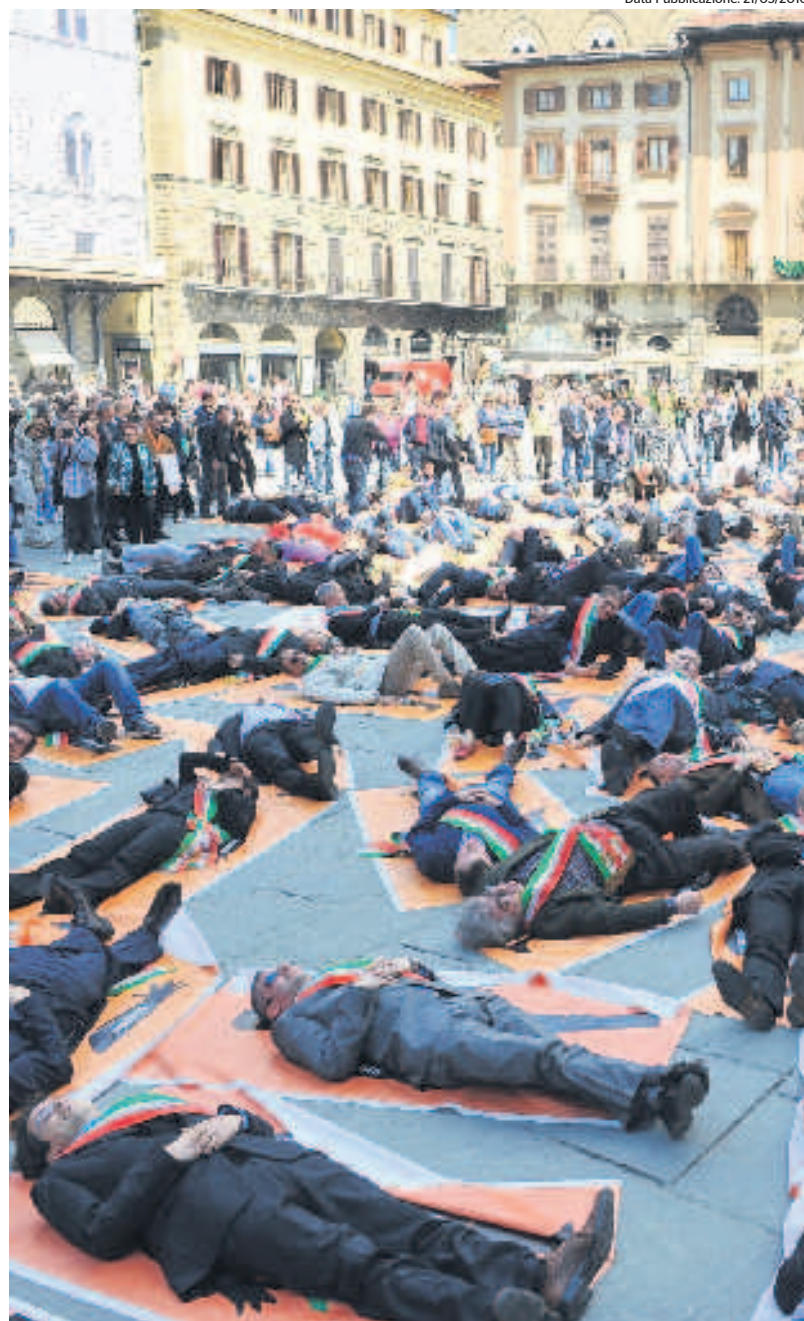
I comuni colpiti dalla manovra, la protesta dei sindaci a Firenze